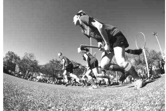
Die Brocken Hexen bleiben Pfützenssee auf den Fersen

Wir können uns auf ein spannendes Pokalfinale am nächsten Samstag freuen: Beide Finalteilnehmer, die Eintracht aus Pfützenssee und die Brocken Hexen gewannen ihre Ligaspiele. Erwähnenswert dabei, dass beide anscheinend keinen Wert mehr auf ihre Abwehr legen, sondern durch beeindruckende Angriffe von sich reden machten, offensichtlich inspiriert von dem berühmten Ausspruch „Den Gegner durch permanentes Toreschießen zermürben“. Das Pokalfinale verspricht also ein wahres Torfestival zu werden.